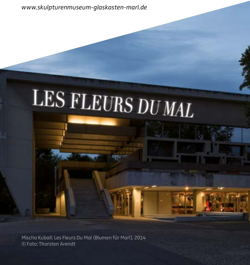
Mischa Kuball: Les Fleurs Du Mal (Blumen für Marl), 2014